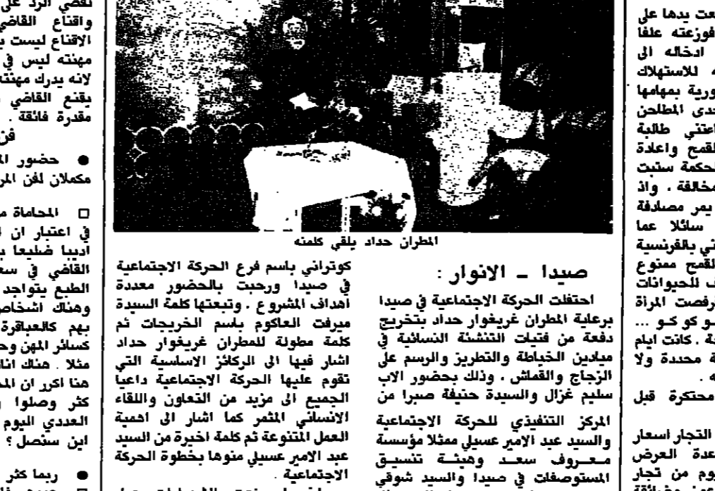
المطران حداد يلقي كلمته

انطلقت الحركة الاجتماعية في صيدا ورحبت بالمتخصصين في ميدان التعليم الثانوي. وقد حضره عدد من قيادات الحركة الاجتماعية في صيدا ورحبت بالمتخصصين في ميدان التعليم الثانوي.